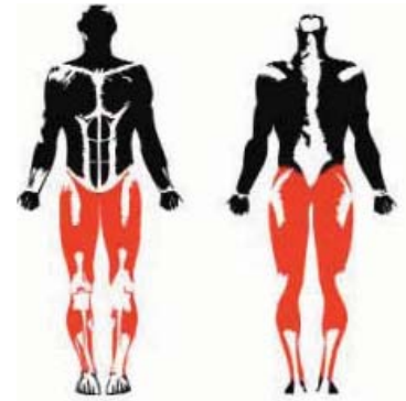
MÚSCULOS EJERCITADOS TRAINED MUSCLES MUSCLES ENTRAÎNÉS