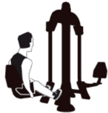
EJECUCIÓN EXECUTION EXÉCUTION