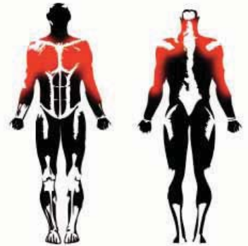
MÚSCULOS EJERCITADOS TRAINED MUSCLES MUSCLES ENTRAÎNÉS