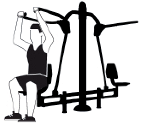
EJECUCIÓN EXECUTION EXÉCUTION