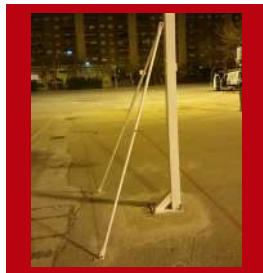
(2) Tirantes inferiores