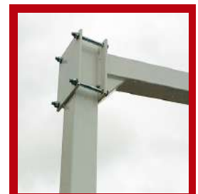
Amarre doble pletina vuelo