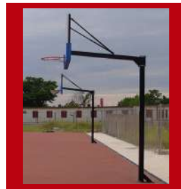
(3) Disponible en color negro