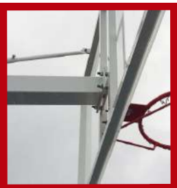
(1) Tuercas de amarre y nivelación

Monoposte y vuelo: 100 x 100 x 3 mm Tirantes: 25-30 mm