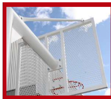
(1) Detalle del tablero