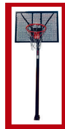
(2) Opción en negro