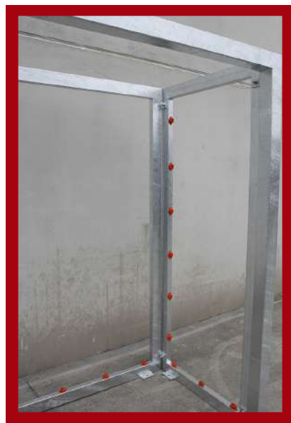
(1) Detalle marcos laterales