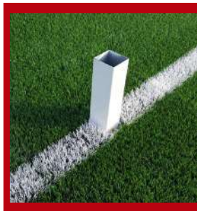
(2) Pieza de unión entre el bote y la portería.