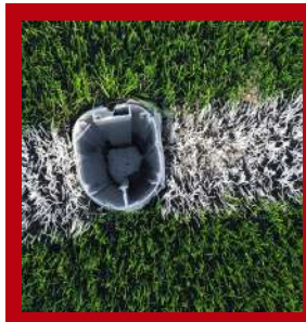
(1) Bote empotrado en el suelo.