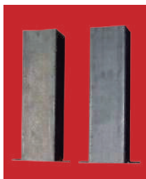
(3) Detalle de los botes