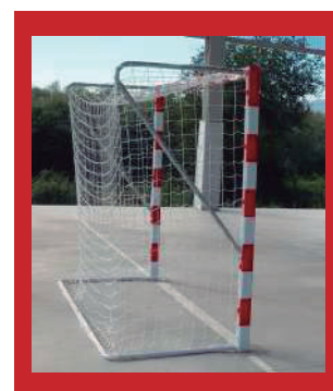
(2) Detalle de la portería por detrás con base opcional