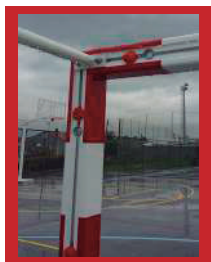
(1) Detalle de la escuadra