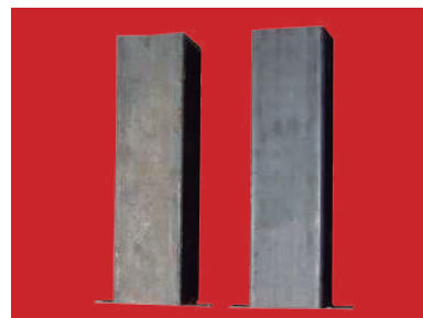
(2) Detalle de los botes