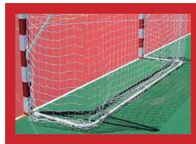
(1) Detalle de portería por detrás con base opcional